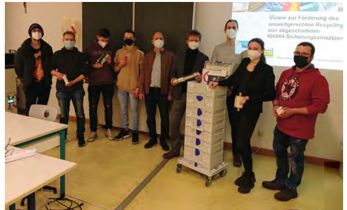
Berufliches Schulzentrum Weiden, Februar 2022

Resultat beteiligen sich viele Berufsschulen, in denen der Lernzirkel „Überstromschutzorgane“ ein fester Bestandteil des Unterrichts ist, als aktive Sammler für den NH/HH-Recyclingverein. Das geschieht auch sehr oft in Zusammenarbeit mit örtlichen Unternehmen, Handwerksbetrieben oder Innungen.