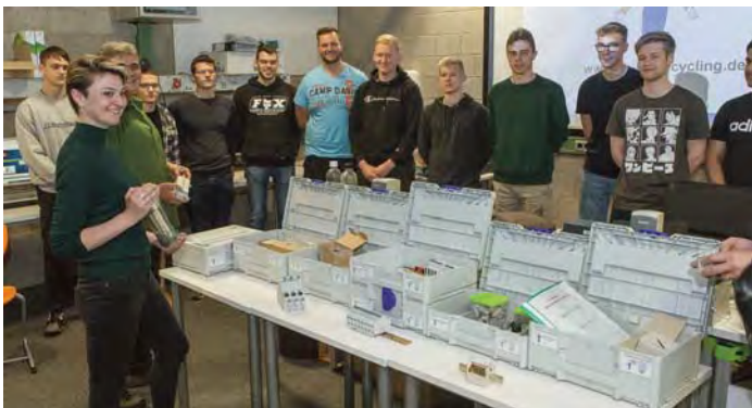
Berufsbildende Schule Alfeld (Leine), Mai 2022