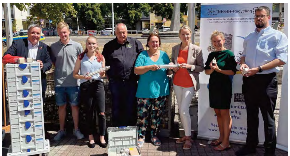
Ein voller Erfolg für Nachhaltigkeit und Umwelt: Pressekonferenz zum Abschluss der einjährigen Sammelaktion der baden-württembergischen Berufsschulen.

Insgesamt wurden bei dieser Aktion rund 4 Tonnen abgeschalteter Schmelzsicherungen gesammelt. Durch das fachgerechte Recycling werden daraus ca. 650 kg Kupfer und ca. 7 kg Feinsilber zurückgewonnen. Um diese Mengen neu zu fördern, müssten in Kupfer- und Silberminen rund 60 Tonnen Erz abgebaut und verarbeitet werden. Dazu wäre ein Bedarf an Primärenergie für die Produktion von ca. 13,5 MWh notwendig, was durch das Recycling der Rohstoffe vermieden wird. Diese Energieeinsparung entspricht einer Verminderung von rund 7 Tonnen CO 2 Treibhausgas-Emissionen.