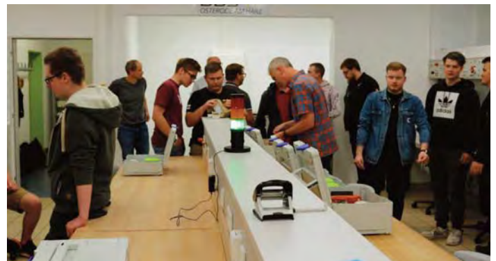
Berufsbildende Schule II Osterode, Mai 2022