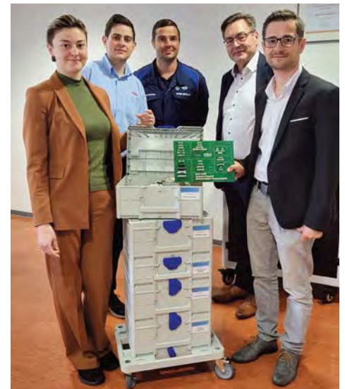
Staatliches Berufsschulzentrum „Heinrich Ehrhardt“ Eisenach, November 2022

Im Berichtszeitraum wurden an vier Berufsschulen für die Fachbereiche Elektrotechnik und Mechatronik ein Lernzirkel „Überstromschutzorgane“ vergeben.